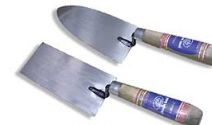
MSP: 3BH01 / 3BH02 / 3BH03

Lưỡi thép răng cưa có độ đàn hồi, cán gỗ. Dùng để trát bột lên tường, Flexible notched steel blade, wooden handle. Used for spreading tile laying glue.