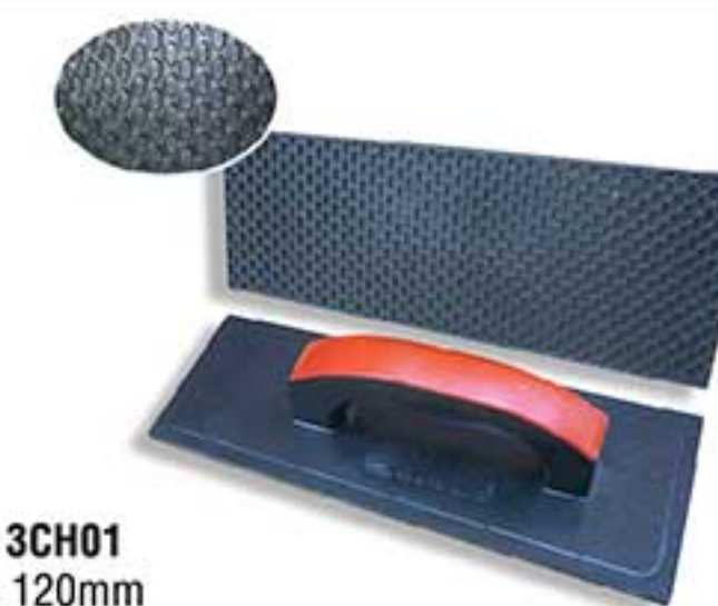
MSP: 3CH01 300 x 120mm

Sợi thép được cho vào đầu đồng. Dùng để lấy đi bụi bẩn, gỉ sắt, vảy sơn trước khi sơn. Steel wire put in brass head. Used for rust, scale, paint slag removing and cleaning of the surfaces before painting.