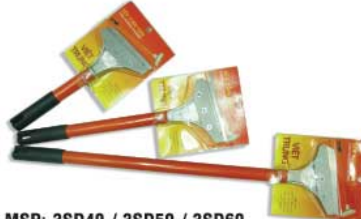
MSP: 3SD40 / 3SD50 / 3SD60

Cán nhựa, đầu nhựa. Dùng để lấy sơn rơi vãi trên kính, sàn nhà hoặc tháo giấy dán tường. Plastic handle, plastic head. Ideal for dropped paint removing from glass or floor, or wallpaper removing.