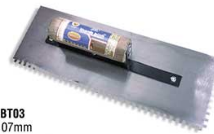
MSP: 3BT03 300 x 107mm

Lưỡi thép có độ đàn hồi, cán gỗ. Dùng để trát bột lên tường. Flexible steel blade, wooden / plastic handle. Used for spreading plaster on the wall surface.