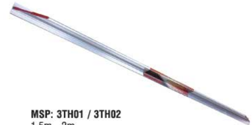
MSP: 3TH01 / 3TH02

Lưỡi thép, cán gỗ. Dùng để lấy đi sơn, bột trét hoặc mở nắp thùng sơn. Steel blade, wooden handle. Ideal for paint, putty removing or opening lid of paint pot.