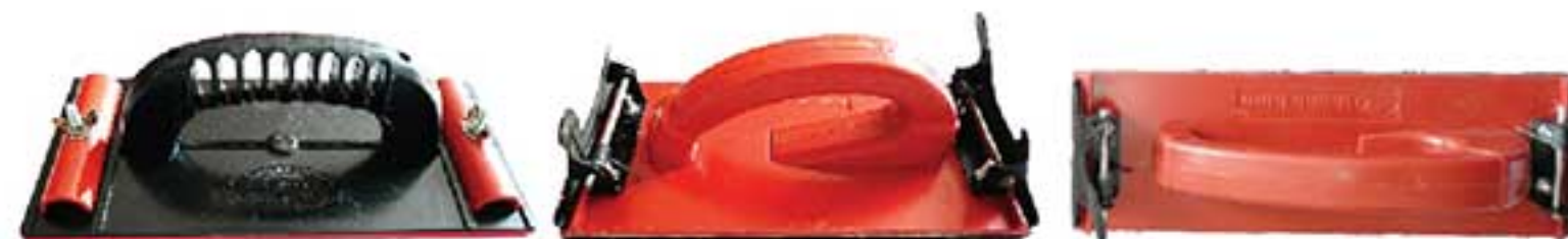
MSP: 3CN01 110 x 220mm

Khung nhựa / sắt, cần đẩy bằng sắt. Dùng để trám các đường khe nhỏ giữa tường và các gờ gỗ trong và ngoài nhà bằng chất chống thấm hoặc silicon. Plastic / iron frame, iron plunger. Used to fill cracks between wood trim and walls inside and outside the house with sealant or silicon tube.