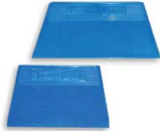
MSP: 3DT01 3DT02

Làm bằng thép tôi cứng với cán không sơn. Sử dụng khi tô vữa tường, dùng để tạo các góc vuông chuẩn theo cột, tường. Hardened and tempered steel blades with un-painted wooden handles. Used for accurate corner finishing when plastering.