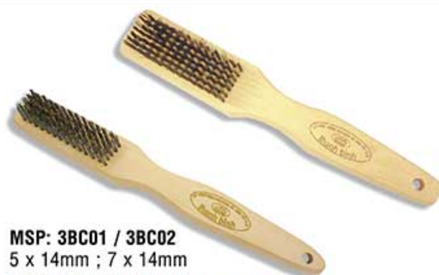
MSP: 3BC01 / 3BC02 5 x 14mm ; 7 x 14mm

Cán đỏ. Dùng để chà và làm phẳng các bề mặt kẹt góc của lớp bột trang trí với một miếng giấy nhám. Comfortable red plastic handle. Used to sand and smooth the corner of plastering compound surface with a piece of sand-paper.