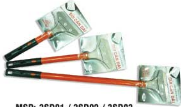
MSP: 3SD01 / 3SD02 / 3SD03

Miếng nhựa trắng đàn hồi dùng trát bột. Flexible white plastic slice for putty spreading.