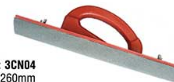
MSP: 3CN04 38 x 260mm

Cán, lưng bằng nhựa với tấm mút. Kẹp chắc chắn. Để chà và làm phẳng lớp bột trang trí với một miếng giấy nhám. Comfortable handle and backing plate with bonded foam pad. Positive plastic clamps. Used to sand and smooth the plastering compound surface with a piece of sandpaper.