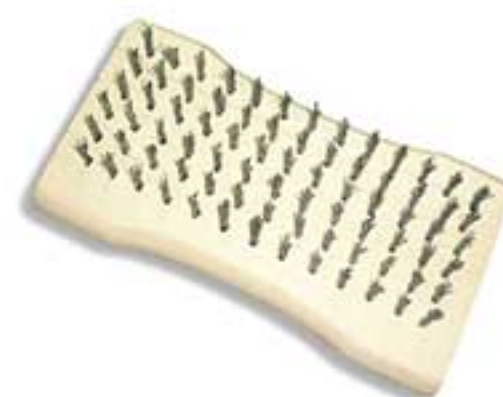
MSP: 3BC03 6 x 13mm

Sợi thép được ghim vào cán gỗ thành 5 hàng / 7 hàng. Dùng để lấy đi bụi bẩn, gỉ sắt, vảy sơn trước khi sơn. Steel wire embedded in wooden handle in 5 rows / 7 rows. Used for rust, scale, paint slag removing and cleaning of the surfaces before painting.