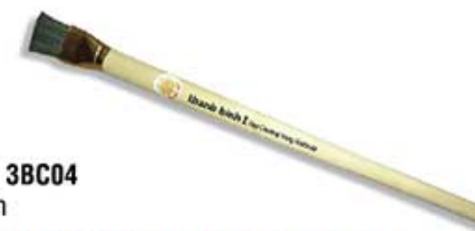
MSP: 3BC04 20mm

Sợi thép được ghim vào cán gỗ thành 6 hàng. Dùng để lấy đi bụi bẩn, gỉ sắt, vảy sơn trước khi sơn. Steel wire embedded in wooden handle in 6 rows. Used for rust, scale, paint slag removing and cleaning of the surfaces before painting.