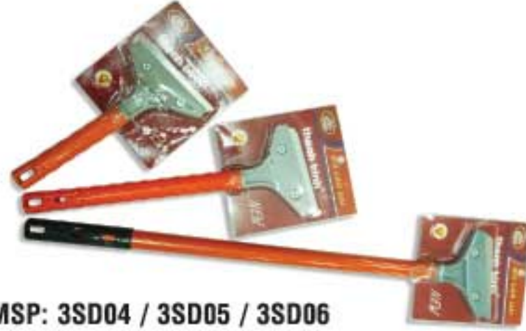
MSP: 3SD04 / 3SD05 / 3SD06

Cán sắt, đầu nhôm. Dùng để lấy sơn rơi vãi trên kính, sàn nhà hoặc tháo giấy dán tường. Iron handle, aluminum head. Ideal for dropped paint removing from glass or floor, or wallpaper removing.