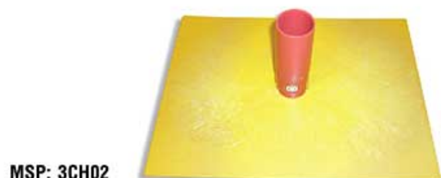
MSP: 3CH02 220 x 300mm

Bề mặt nhựa dạng tổ ong. Dùng để làm phẳng và hoàn tất bề mặt xi măng hoặc vữa hồ. Beehive plastic surface. Used for smoothing and finishing the surface of cement or stucco.