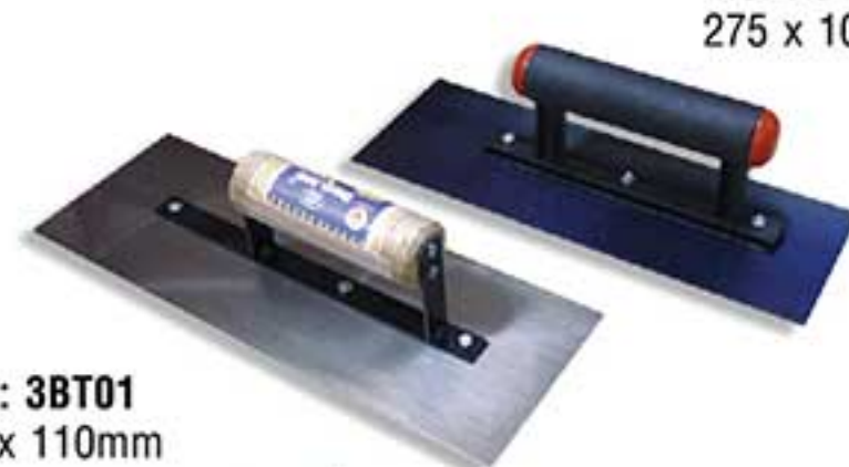
MSP: 3BT02 275 x 100mm

Nhựa tấm màu vàng, nhẹ nhưng bền, cán đỏ có thể gấp lại. Dùng để giữ vữa hồ trên tay trong quá trình thi công. Yellow plastic plate, lightweight but durable, foldable. Used for holding plaster during application.