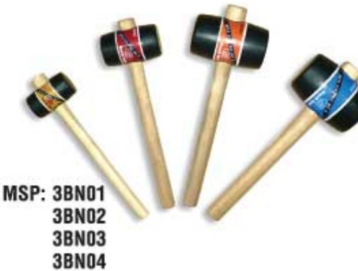
MSP: 3BN01 3BN02 3BN03 3BN04

Dùng với máy khoan để quậy đều sơn, bột trét, xi măng. Use with electric drills for paint, plaster, cement slurries & textured coatings mix.